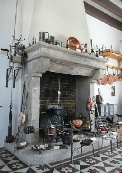
Cheminée avec tournebroche d'époque Louis XIV

Bienvenue au premier Musée de France consacré aux Ustensiles de Cuisine Anciens et à leur évolution à travers le temps.