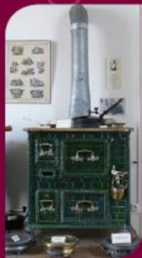
Cuisinière émaillée 1925

Collection de couperets- hachoirs du XVII e au XIX e s.