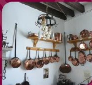
Coin cuivres XIX e et XX e

Vous découvrirez 1 500 objets répartis sur six salles d'exposition avec des thèmes différents tels que : la pâtisserie, la conservation, et, qui vous séduiront par leur diversité.