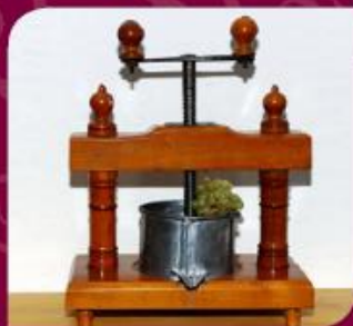
Pressoir de ménage 1900

Place Clemenceau - 85170 Saint-Denis-la-Chevassse Tél. musée : 02 51 41 39 01 - Tél. mairie : 02 51 41 48 48