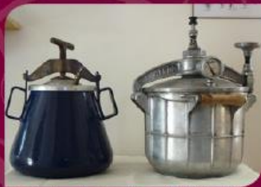
Collection d'autocuiseurs de 1920 à 1960

Vous découvrirez 1 500 objets répartis sur six salles d'exposition avec des thèmes différents tels que : la pâtisserie, la conservation, et, qui vous séduiront par leur diversité.